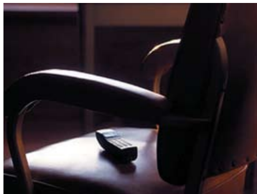
Президент Молдавии Николай Тимофти также пока не готов представить парламенту

Лидер Демократической партии, председатель парламента Мариан Лупу заявил, что «преждевременно говорить о кандидатурах на пост премьер-министра». Он отказался комментировать пози-