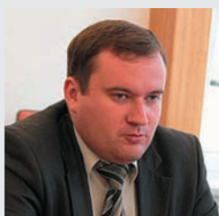
Владимир ЯСТРЕБЧАК, экс-глава МИД Приднестровья, политический эксперт

Пока сложно говорить о серьезных изменениях в реальном секторе экономики Молдовы. Падение отмечено по отдельным товарным группам, но пока еще не привело к существенным последствиям для молдавской экономики. Молдавские власти пытаются предпринимать усилия для того, чтобы смягчить негативный эффект для некоторых экспортеров; кроме того, активно изыскиваются возможности для того, чтобы обойти российские запреты через иные «точки доступа» на рынок России. Вполне возможно, что в Кишиневе попытаются привлечь и внешние финансовые ресурсы для поддержки уязвимых отраслей, однако вряд ли эти перспективы реалистичны.