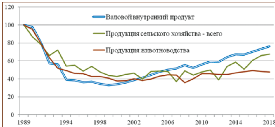
Рис. 1. Динамика ВВП и индексов сельскохозяйственного производства за 1989–2018 годы, %