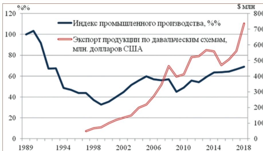
Рис. 2. Динамика индексов промышленного производства и объемов экспорта продукции по давальческим схемам за 1989–2018 годы

Безальтернативно проглотив навязанную западными кураторами по развитию пилюлю, отравленную безответственной либерализацией внешнеторговой деятельности в части снятия всех барьеров на пути импорта, мы своими собственными руками создали условия для повсеместного наплыва иностранных товаров. И под эту вакханалию импортной экспансии в тихую безусловным лидером в дефиците торгового баланса стал Китай: при молдавском экспорте в эту страну за первое полугодие нынешнего года в $7,9 млн. импорт составил $277,8 млн или в 35 раз больше! В тоже время, в отличие от Молдовы, Китай всячески защищает свой рынок, как и многие другие государства мира, включая и Европейский союз.