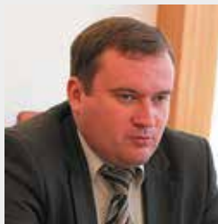
Владимир ЯСТРЕБЧАК , экс-министр иностранных дел Приднестровской Молдавской Республики (ноябрь 2008 – январь 2012 г.)

“ На данный момент достаточно сложно комментировать ход кампании по выборам в местные органы власти, хотя очевидно, что противостояние может стать достаточно жестким. Безусловным может считаться лишь то, что данная кампания будет самым существенным испытанием для коалиции, созданной между Партией социалистов РМ (ПСРМ) и блоком АСУМ.