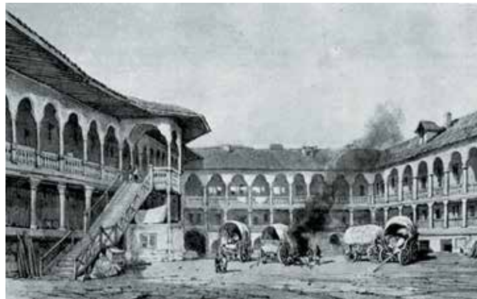
Гостиница Манук-бея в Бухаресте, где был подписан Бухарестский договор

Блистательной Порты Оттоманской Агмед-паши, с тем, чтоб для постановления, заключения и подписания мирного договора избраны, назначены и подлежащей полной доверенностью от обеих сторон снабжены были достойные особы; вследствие чего от стороны Российской императорской избраны, назначены и уполномочены превосходительные и высокопочтенные господа: Андрей Италийский, Его Императорского Величества тайный советник, и прочее, Иван Сабанеев, от армии Его Императорского Величества генерал-лейтенант, начальник Генерал-штаба Дунайской большой армии, и прочее, и Иосиф Фонтон, Его Императорского Величества действительный статский советник, и прочее; со стороны же Блистательной Порты Оттоманской