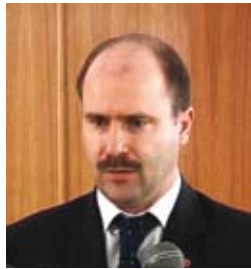
Валериу ЛАЗЭР, заместитель премьер-министра, Министр экономики Республики Молдова

1986–1993 гг. – сотрудник Министерства иностранных дел.