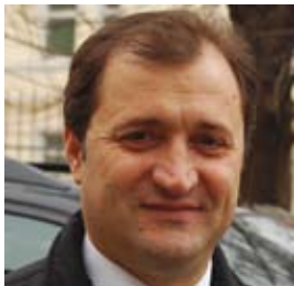
Владимир ФИЛАТ, премьер-министр Республики Молдова

С 11 сентября 2009 года — исполняющий обязанности президента Молдавии.