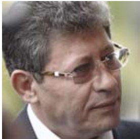
Михай ГИМПУ, председатель Парламента, и.о. Президента Республики Молдова

Р одился 19 ноября 1951 года в селе Колоница, Кишиневского района Молдавской ССР.