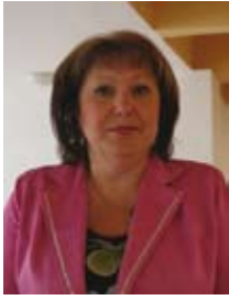
ЧЕРНЕНКО Елена Егоровна, Министр экономики ПМР

Родилась 17 апреля 1957 года, в г. Фокино, Брянской области, РСФСР.