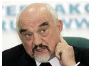
СМИРНОВ Игорь Николаевич, Президент ПМР

Указом Президента Республики Молдова № 4-V от 25 сентября 2009 г. назначен на должность Заместителя Премьер-министра, Министра экономики.