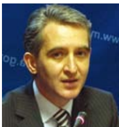
Юрие ЛЯНКЕ, заместитель премьер-министра, Министр иностранных дел и европейской интеграции Республики Молдова

Указом Президента Республики Молдова № 4-V от 25 сентября 2009 г. назначен на должность премьер-министра.