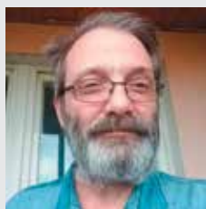
Марк БЕРНАДИРИ, итальянский и российский политолог, переводчик

“ Не считаю, что это украинская идеология. Во-первых, а что такое ныне столь поносимое во всем мире, особенно на Западе, определение «идеология»? Это всего лишь система воззрений на социально-политическую жизнь. Что ж, в таком случае лично я отвергаю ту отрицательную окраску, присущую оппонентам, дескать, ты фанатик, в плену идеологии.