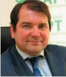
Владимир КОРНИЛОВ, политический обозреватель МИА «Россия сегодня»

“ Правительство Гончарука изначально было временным. Эти люди были приведены во власть исключительно с одной целью: обеспечить продажу земли, принять весь негатив на себя и после этого уйти. Но эта команда теоретиков, не имеющая никакого практического опыта хозяйственно-экономической работы,