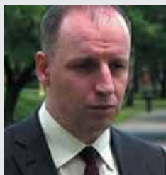
Богдан БЕЗПАЛЬКО, член Совета по международным отношениям при Президенте России

“ Очевидно, что нет. Украина по-прежнему находится в долговой яме, по-прежнему наблюдаются процессы деиндустриализации и депопуляции, а сейчас еще и пандемия COVID-19. Очевидно, что