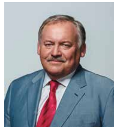
Константин ЗАТУЛИН, первый заместитель председателя Комитета Государственной Думы РФ по делам СНГ, евразийской интеграции и связям с соотечественниками, руководитель Института стран СНГ

С таким антирейтингом, как Порошенко, пролезть в игольное ушко можно только в условии беззастенчивой фальсификации, которая должна по моим представ-