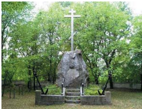
Памятник – символическая могила (камень и крест) сыну и племяннику и всем русским морякам, погибшим в Цусиме

ским и без ключей. Вскрывать дверей на месте не пришлось: все ключи оказались неведомыми путями у владельцев имения гр. Игнатьевых. Имение это – старое помещичье гнездо, владельцы его – потомки самых богатых и аристократических фамилий России, думалось, что тут должны быть сокровища совершенно исключительные, родовые вещи Голицыных, Толстых, Кутеповых, самого Кутузова. Но при осмотре оказалось, что ничего особенно интересного нет или не осталось: так мебель почти вся современная или конца прошлого века, а из старинной я нашел лишь туалет красного дерева с пирамидами эпохи Александра I, комода в стиле Жакоб, да красного дерева бюро и полку более поздней работы. Картин оказалось много, но почти исключительно фамильные портреты и портреты русских императоров. Почти все картины исполнены неизвестными, относятся к концу XVIII, началу XIX столетия. Некоторые копированы известным Митрохиным, первым реставратором Эрмитажа, есть интересные портреты Бибикова, работы Клюквина, портреты Кутузова, Остермана, копия знаменитого портрета Екатерины II с собачкой, два старинных вида Петербурга и т.д. В числе гравюр не нашлось ни одной замечательной, только четыре из них были английскими, в красках, пос-