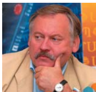
К.Ф. ЗАТУЛИН, директор Института стран СНГ

Уважаемые друзья! Мы не разделяем — я и мои сотрудники — своей судьбы, от судьбы русских в Севастополе, в Крыму, на Украине. Мы находимся в довольно сложной точке политического времени и пространства. Мы все прекрасно помним недавнее прошлое. Я лично его помню особенно отчетливо: я в течение пяти лет был трижды объявлен персоной нон грата прежним руководством Украины. Мы помним, что происходило. Мы помним, что в политической борьбе против «оранжевых», против тех, кто хотел бы свернуть цивилизационный общий путь развития России и Украины, выступала Партия регионов, Компартия, целый ряд других организаций и сил, в том числе и организации русские, русскоязычные организации. Не всегда вместе, не всегда координируясь между собой, но имея общую цель.