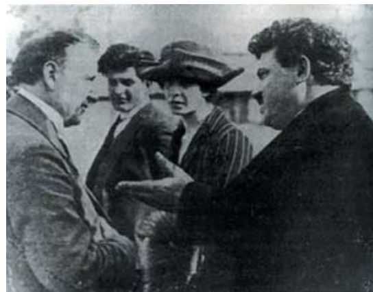
Христиан Раковский (слева) на Генуезской конференции убеждает премьер-министра Болгарии Александра Стамболийского в верности новых республик славянским ценностям и надежной дружбе

Если упомянуть еще о кипе бумаг, относящихся к середине XVIII века – счета и рапорты управляющих имениями, отпускные, патенты, копии манифестов и грамот – то эти ограничатся описание достопримечательностей имения.