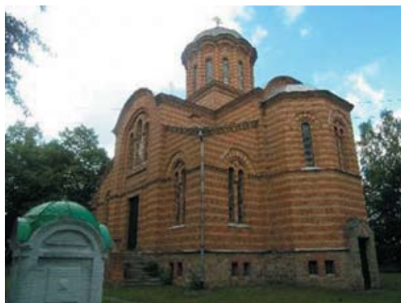
Храм-некрополь, творение рук архитектора Померанцева

В день моего приезда в имении, находящемся в шести верстах от Погребища, по слухам, тоже орудовал какой-то полк. Я предложил тов. Мушиманскому созвать на следующее утро комиссию. Однако, несмотря на то, что приглашение собраться было сделано в самой категорической форме, никто не явился и пришлось три раза посылать в ревком за ключами от опечатанных в имении комнат. Все же до 12-ти часов дня ключи доставлены не были, т.к. до этого времени никого в ревкоме не было. Тогда я решил ехать в имение вдвоем с тов. Мушиман-