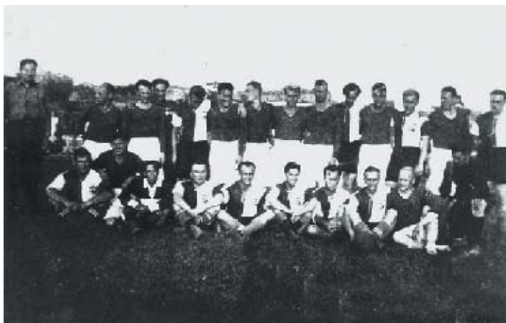
Редчайший снимок участников матча 9 августа 1942 года в Киеве, сделанный, по некоторым сведениям, немецким судьей встречи. Киевские футболисты в темных (красных) футболках, немцы в светлых. Именно эта фотография стала основным документом обвинения советских футболистов.