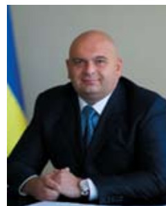
ЗЛОЧЕВСКИЙ Николай Владиславович

Родился 14.06.1966 г. в Киеве. 1991–1999 гг. – на руководящих постах в коммерческих структурах, в том числе заместитель директора ООО «Инфокс» (Киев). 1999–2000 гг. – глава правления ЗАО «Укрнефтесервис». 1998–2000 гг. – член координационного совета предпринимателей при Президенте Украины Леониде Кучме. 2000–2002 гг. – вице-президент ООО «Инфокс». 2002–2004 гг. – народный депутат Украины IV созыва от Социал-демократической партии (объединенной). 2003–2005 гг. – глава Государственного комитета природных ресурсов. 2006–2007 гг. – народный депутат V созыва от Партии регионов. Член Комитета Верховной Рады Украины по вопросам топливно-энергетического комплекса, ядерной политики и ядерной безопасности. С 2007-го – народный депутат VI созыва от ПР. Член Комитета ВР по вопросам бюджета. 25 марта 2010 года распоряжением Кабинета Министров Николая Азарова был назначен главой Государственного комитета Украины по материальному резерву. Второго июля 2010 года был назначен на должность Министра экологии и природных ресурсов Украины.