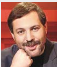
Михаил ЛЕОНТЬЕВ, главный редактор журнала «Однако»

“ На самом деле, соглашения действуют. И, самое главное, что Черноморский флот потихонечку превращается в подобие флота. Там есть куча сложных проблем, но, во всяком случае, он работает, потому что раньше это была зависшая ситуация, и флот деградировал и в типологическом смысле, и во всяких других. Снята острота проблемы. С сугубо прагматической точки зрения, все хорошо.