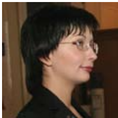
ЛУКАШ Елена Леонидовна

Указом президента Украины № 289/2010 от 04.03.2010 года Е. Лукаш назначена заместителем Главы Администрации Президента Украины – Представителем Президента Украины в Конституционном Суде Украины.