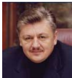
СИВКОВИЧ Владимир Леонидович

Верховный Совет Украины постановлением № 6177 от 11.03.2010 «О формировании состава Кабинета Министров Украины» назначил Сивковича Владимира Леонидовича на должность вице-премьер-министра Украины.