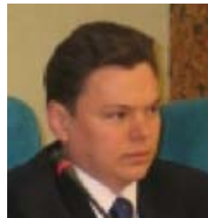
ЕФИМЕНКО Константин Алексеевич

Верховный Совет Украины постановлением № 6177 от 11.03.2010 «О формировании состава Кабинета Министров Украины» назначил Ефименко Константина Алексеевича на должность Министра транспорта и связи Украины.