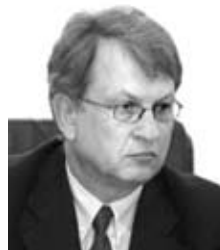
ЯРОШЕНКО Федор Алексеевич

Верховный Совет Украины постановлением № 6177 от 11.03.2010 «О формировании состава Кабинета Министров Украины» назначил Ярошенко Федора Алексеевича на должность Министра финансов Украины.