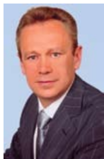
ПРИСЯЖНЮК Николай Владимирович

Верховный Совет Украины постановлением № 6177 от 11.03.2010 «О формировании состава Кабинета Министров Украины» назначил Присяжнюка Николая Владимировича на должность Министра аграрной политики Украины.