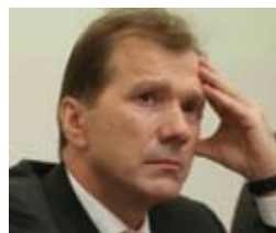
САФИУЛЛИН Равиль Сафович

Верховный Совет Украины постановлением № 6177 от 11.03.2010 «О формировании состава Кабинета Министров Украины» назначил Сафиуллина Равиля Сафовича на должность Министра Украины по делам семьи, молодежи и спорта.