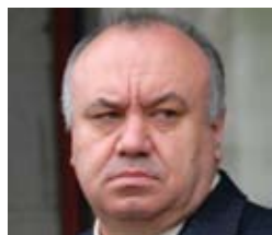
ЦУШКО Василий Петрович

Верховный Совет Украины постановлением № 6177 от 11.03.2010 «О формировании состава Кабинета Министров Украины» назначил Цушко Василия Петровича на должность Министра экономики Украины.