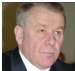
СЛАУТА Виктор Андреевич

Верховный Совет Украины постановлением № 6177 от 11.03.2010 «О формировании состава Кабинета Министров Украины» назначил Слауту Виктора Андреевича на должность вице-премьер-министра Украины.