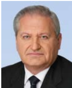
ТИХОНОВ Виктор Николаевич

Верховный Совет Украины постановлением № 6177 от 11.03.2010 «О формировании состава Кабинета Министров Украины» назначил Тихонова Виктора Николаевича на должность вице-премьер-министра Украины.