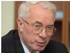
АЗАРОВ Николай Янович

Верховный Совет Украины принял постановление № 6176 от 11.03.2010 «О назначении Н.Я. Азарова премьер-министром Украины».