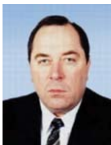
ДЕМЯНКО Николай Иванович

Член Комитета по вопросам Регламента, депутатской этики и обеспечения деятельности Верховной Рады Украины (с декабря 2007 г.), председатель подкомитета по вопросам обеспечения деятельности народных депутатов Украины (с января 2008 г.).