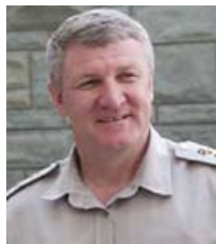
ЕЖЕЛЬ Михаил Брониславович

Верховный Совет Украины постановлением № 6177 от 11.03.2010 «О формировании состава Кабинета Министров Украины» назначил Ежеля Михаила Брониславовича на должность Министра обороны Украины.