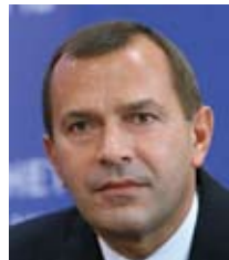
КЛЮЕВ Андрей Петрович

Кабинета Министров Украины» назначил Клюева Андрея Петровича на должность Первого вице-премьер-министра Украины.