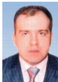
КОЛЕСНИКОВ Дмитрий Валерьевич

Верховный Совет Украины постановлением № 6177 от 11.03.2010 «О формировании состава Кабинета Министров Украины» назначил Колесникова Дмитрия Валерьевича на должность Министра промышленной политики Украины.