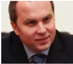
ШУФРИЧ Нестор Иванович

Верховный Совет Украины постановлением № 6177 от 11.03.2010 «О формировании состава Кабинета Министров Украины» назначил Шуфрича Нестора Ивановича на должность Министра Украины по вопросам чрезвычайных ситуаций и вопросам защиты населения от последствий Чернобыльской катастрофы.