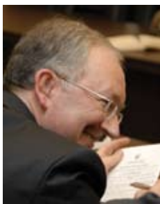
ОЛЕЩЕНКО Вячеслав Иванович

Член Комитета по вопросам Регламента, депутатской этики и обеспечения деятельности Верховной Рады Украины (с декабря 2007 г.).