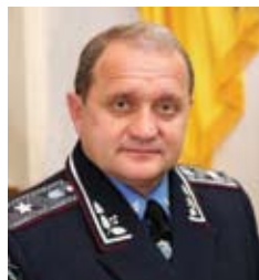
МОГИЛЕВ Анатолий Владимирович

Верховный Совет Украины постановлением № 6177 от 11.03.2010 «О формировании состава Кабинета Министров Украины» назначил Могилева Анатолия Владимировича на должность Министра внутренних дел Украины.