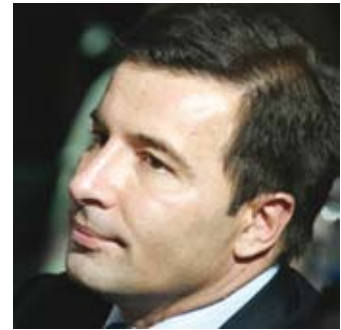
Валерий КОНОВАЛЮК, депутат Верховной Рады Украины

Я могу сказать с точки зрения того, что сделано с 98-го года. Я занимаюсь российско-украинскими отношениями, стал заместителем председателя Межпарламентской группы дружбы Украины и России, и могу вам ответственно заявить, что такого формализованного уровня отношений, наверное, нет ни с одним государством. Подписано более 380 соглашений, различных рамочных договоров, различных протокольных решений, и вы знаете, что степень реализации всего очень с низким КПД. Могу также сказать, что более 40 этих соглашений практически утратили свою силу, так и не вступив в этап реализации.