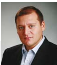
Добкин Михаил Маркович