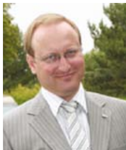
Боярчук Алексей Валерьевич

С 12.2007 г. – заместитель Министра юстиции Украины.