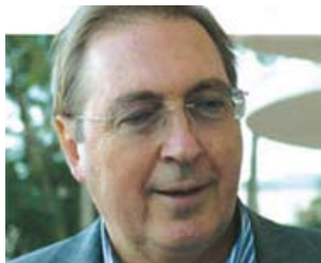
Дмитрий Выдрин, заместитель секретаря Совета национальной безопасности и обороны Украины