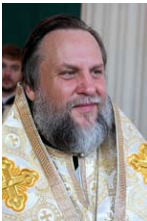
Архиепископ Тульчинский и Брацлавский ИОНАФАН (Елецких)

Представление проблемы на примере анализа программных деклараций представителей Украинской Православной Церкви Московского Патриархата и неканонических религиозных организаций: «УАПЦ» и «УПЦ-КП»