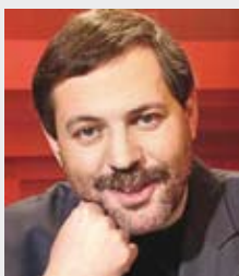
Михаил ЛЕОНТЬЕВ, главный редактор журнала «Однако»

“ Местные выборы отличаются тем, что у них, в отличие от партий общеукраинских, которых и так много, есть некоторые партии местные, которые на общеукраинских выборах шансов имеют мало, и поэтому даже их, может быть, потенциальные избиратели за них не голосуют. А на местных выборах за них будут голосовать, т.е. есть очень много локальных структур, ну, например, нежно любимая мною одесская «Родина», у которой никаких шансов на выборах общеукраинских пока нет, но зато в Одессе она очень заметна, она входит в различные альянсы, коалиции и т.д., но, тем не менее, она заметна. И таких будет довольно много. Украина вообще очень регионализована. Потом, учитывая, что политика на общеукраинском уровне в очень сильной степени профанирована, она такая большая, малодоступная для мелких игроков, то «живая» политика опускается в регионы. Поэтому там будет все гораздо более живо, гораздо более случайно.