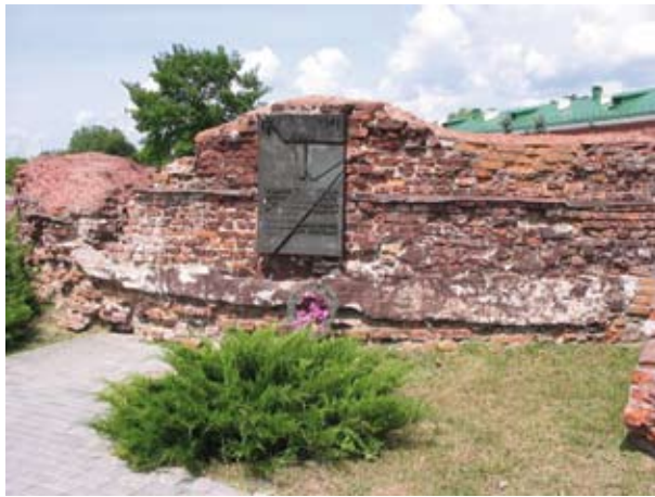
Руины Белого дворца (где был подписан Брестский мир в 1918 г.)

Главный представитель Австро-Венгрии министр иностранных дел граф Чернин решительно отверг все территориальные требования, расценив их как вмешательство во внутренние дела Австрии. Германия заняла такую же позицию, хотя она выражала готовность удовлетворить украинские претензии на Холмскую область.