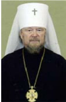
Лазарь, митрополит Симферопольский и Крымский (Швец Ростислав Филиппович)

Указом президента Украины №254/2009 от 21 апреля 2009 года митрополит Симферопольский и Крымский Лазарь (Швец Ростислав Филиппович) награжден орденом князя Ярослава Мудрого V степени.