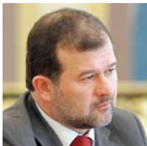
БАЛОГА Виктор Иванович

Указом президента Украины № 337/2009 от 19 мая 2009 года БАЛОГА Виктор Иванович освобожден от должности Главы секретариата президента Украины.