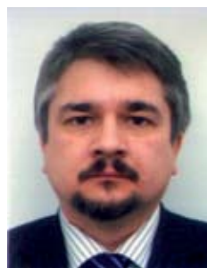
Ростислав ИЩЕНКО, президент Центра системного анализа и прогнозирования:

В. КУЛИК: Возможно создание широкой общественной коалиции по поддержке пророссийских политических сил, которая могла бы поддержать одного из кандидатов в президенты. С другой стороны – нужна ли поддержка российских политических элит кандидату в президенты? Ведь на этих выборах обязательно будут использоваться лозунги про «руки Москвы», которые могут сильно навредить тому, против кого они будут использованы. Поэтому, такая поддержка возможна путем общественного фронта, или общественной коалиции НПО и политических партий. Это повысило бы роль общественных пророссийских организаций, и развязало бы руки условным, возможным пророссийским кандидатам в президенты.