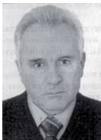
КАРАСИК Юрий Михайлович

Указом президента Украины № 479/2009 от 23 июня 2009 года Карасик Юрий Михайлович назначен Советником Президента Украины (вне штата).