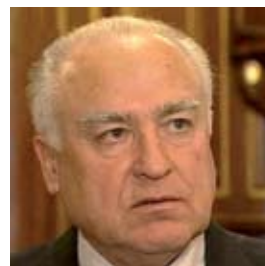
ЧЕРНОМЫРДИН Виктор Степанович

Родился 09.04.1938 в селе Черный Отрог Саракташского района Оренбургской области. В 1966 году окончил Куйбышевский политехнический институт, в 1972-м – экономический факультет Всесоюзного заочного политехнического института.