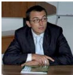
ПЫШНЫЙ Андрей Григорьевич

Указом президента Украины № 484/2009 от 25 июня 2009 года Пышный Андрей Григорьевич освобожден от должности заместителя Секретаря Совета национальной безопасности и обороны Украины.