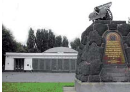
Памятник у станции «Арсенальная» сегодня

8 июля 2009 года Россия и Украина отметили поистине историческую дату – 300-летие со дня Полтавской битвы. Но не только для наших стран эта дата является событием. Ведь исторически эта битва стала эпохальным событием практически для всей Европы. Соответственно, не останется эта дата без внимания и в самой Швеции. Все дело в том, что значение Полтавской битвы именно в том, что решительная и блистательная победа русской армии привела не только к перелому в Северной войне в пользу молодого российского государства, но и положила конец господству Швеции, как главной военной силы в Европе, которую не только опасались, но и боялись Дания, Великобритания, Франция, Польша и Саксония. Нет смысла пересказывать весь ход войны, тем более что период ее проведения захватывает двадцать один год, однако, есть необходимость еще