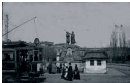
Он же, сто лет назад. Только вместо пушки – Искра и Кочубей...

раз вспомнить о самом кульминационном моменте войны, ставшем победоносным в ее истории – Полтавской битве.