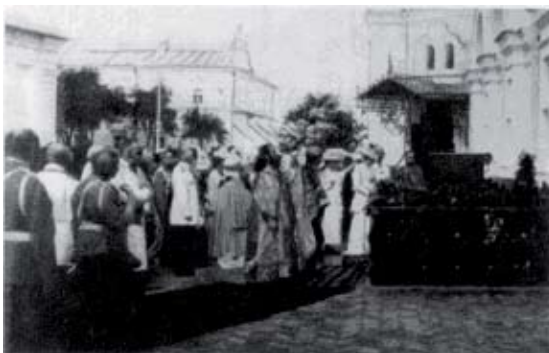
Столыпин П.А. во время пребывания в Киеве посетил в Киево-Печерской Лавре могилу Искры и Кочубея.

Речь идет о том месте славного Киева, где совсем недавно (в историческом летоисчислении, конечно) стоял памятник героям «отдавшим жизнь за царя». Не секрет, что в районе древних Печерских холмов, между нынешней площадью Героев Арсенала и Киево-Печерской лаврой кое-кто желает установить памятник «освободителю украинского народа» гетману-иуде Мазепу. Почему именно там? Да потому, что и сегодня, «этим кое-кому» имена Искры и Кочубея, которые истинно отдали свою родину и отдали жизнь за правду, за что были казнены Мазепой, стоят «как кость в горле». Но их имена в истории не остались забытыми.