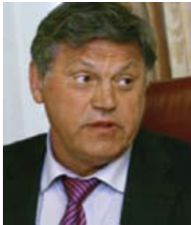
СИМОНЕНКО Валентин Константинович

Указом президента Украины № 1008/2009 от 3 декабря 2009 года Симоненко Валентину Константиновичу присвоено звание Герой Украины.