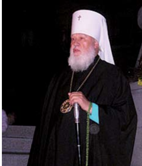
Митрополит Одесский и Измаильский АГАФАНГЕЛ

и Галицкого, сщмч. Прокопия, архиепископа Одесского и Херсонского, прп Кукшу Одесского, прп Лаврентия Черниговского, почитаемого всем православным Донбассом схиархимандрита Зосиму (Сокура), блаженной памяти митрополита Санкт-Петербургского и Ладожского Иоанна (Снычева), выдающегося богослова и старца Русской Зарубежной Церкви архимандрита Константина (Зайцева).