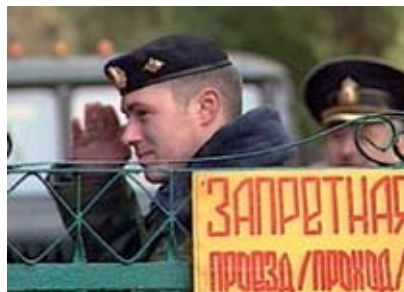
Российский патруль не допускает украинских судебных исполнителей на объект «Марс-75»

Н есмотря на многочисленные договоренности на высшем уровне о том, что все спорные вопросы по поводу эксплуатации маяков и других гидрографических объектов, используемых ныне Черноморским флотом РФ на Украине, должны решаться исключительно в рамках межгосударственных договоренностей на уровне комиссии «Ющенко-Путин», Украина вновь возобновила попытку взять под контроль некоторые объекты, ссы-