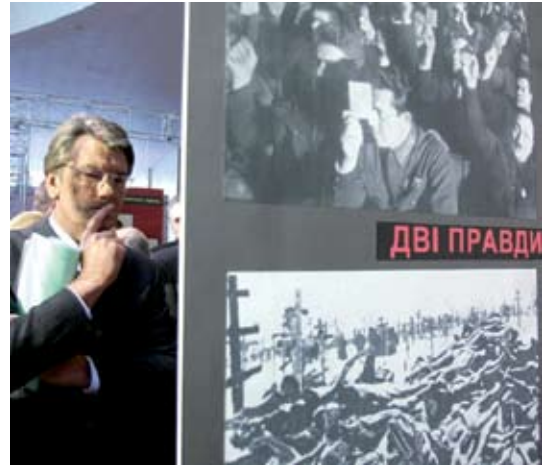
Виктор Ющенко рассматривает фотографии на выставке «Рассекреченная память» . 24 ноября 2006 г.

А ниже мы приводим оригинал этой фотографии – открытку, выпущенную в Брюсселе Комитета Фриггофа Нансена в 1921 г. с целью сбора средств голодающим российскому Поволжью. Этот снимок, как свидетельство – вал сам Нансен и как подтверждают десятки других его