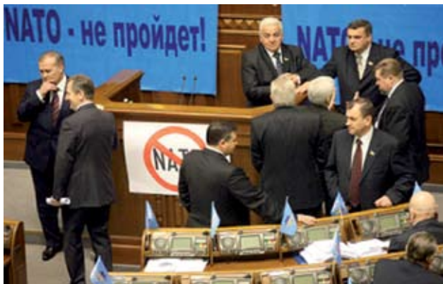
Депутаты ПР заблокировали трибуну Верховной Рады