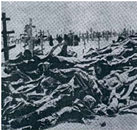
Кладбище в Харькове. Замерзшие трупы украинских селян в голоду. 1933 р.

Это лишь один красочный пример фальсификаций. Фотографии Комитета Нансена очень активно используются современной Украиной для демонстрации масштабов последствий Голодомора 30-х годов.