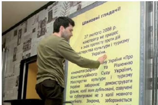
В киевском кинотеатре вывешивают объявление о забастовке

ские националисты. 22 февраля молодчики из организации «Тризуб» имени Степана Бандеры в Киеве ворвались в здание кинотеатра, в котором происходила пресс-конференция организаторов забастовки, начали разбрасывать листовки антироссийского содержания и ломать мебель, чем фактически сорвали мероприятие.