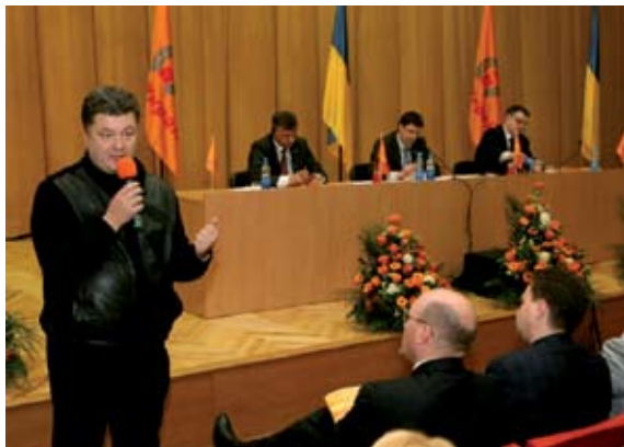
Заседание политсовета НСНУ