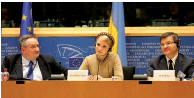
Тимошенко ездит по миру в сопровождении Г. Немыри...

Однако тот визит был сорван, как было сказано в официальном сообщении, по причине болезни премьер-министра. Принимая во внимание неоднократно высказываемое неудовольствие представителями Секретариата украинского президента «российскими» планами премьер-министра, можно сказать, что «болезнь» Тимошенко пришлась как нельзя кстати для Ющенко. В результате, вопреки своим функциональным обязанностям, готовить встречу Путина и Ющенко в Москву поехала секретарь Совета национальной безопасности и обороны Раиса Богатырева, а визит Тимошенко был перенесен на более поздний период.