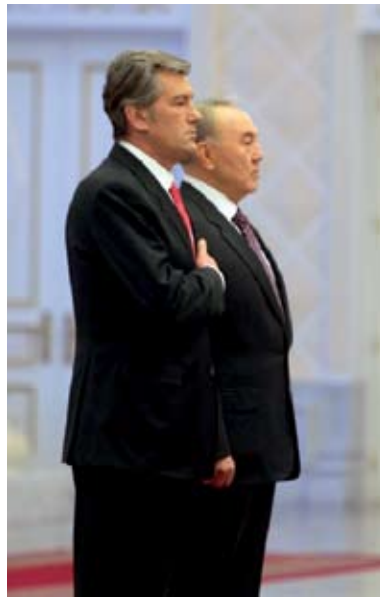
Ющенко и Назарбаев

Казахстана в ВТО после присоединения к этой организации Украины.