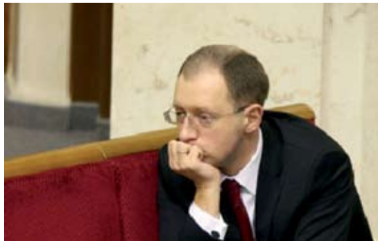
Арсений Яценюк во время блокирования его рабочего места

референдума. При этом в последний момент из постановления был убран пункт о необходимости уведомить об этом Генерального секретаря НАТО.