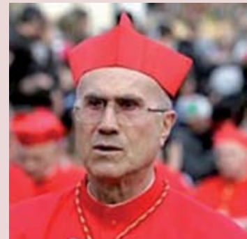
Кардинал Тарчизио БЕРТОНЕ

Кардинал Тарчизио БЕРТОНЕ, Государственный Секретарь, Камерленго Святой Римской Церкви, Архиепископ-эмерит города Генуя (Италия).