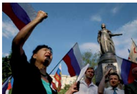
Севастопольцы дали понять мэру города, что не дадут в обиду свою бронзовую Екатерину.

Попытки судебных исполнителей воспрепятствовать сооружению памятника встретили