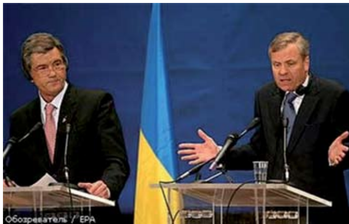
Президент Украины Виктор Ющенко и Генеральный секретарь НАТО Яап де Хооп Схеффер

На самом деле, Иванов мог не употреблять все эти «почти», поскольку мог сослаться на конкретные документы, а не только на предчувствие. Украинские евроатлантисты, понятное дело, редко читают акты, на основе которых работают. Так можно им посоветовать обратиться к Целевому плану «Украина – НАТО» на 2008 год, введенному в действие указом Президента от 1 апреля. Почти четверть этого плана посвящена вопросам украинской границы, включая кордон с Россией. А пункт 2.3.8 гласит, что «стратегическим заданием рефор-