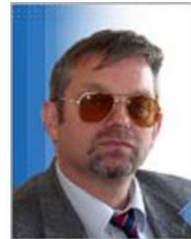
Юрий РОМАНЕНКО, политолог, главный редактор сайта «Главред»:

Цены постоянно повышаться последние 5 лет и экономика постоянно их абсорбирует. Я не думаю, что это повлечет катастрофические проблемы. Проблемы возникают как следствие глобального кризиса экономики, связанного со слабостью финансовых рынков США. Вот это будет главная проблема, которая на самом деле приведет к обвалу цен на нефть и газ. Это объективный фактор.