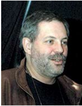
Михаил ЛЕОНТЬЕВ, журналист, ведущий авторской программы «Однако» на Первом канале, главный редактор журнала «Профиль»:

– Какие силы стоят за кризисом «оранжевой» коалиции?