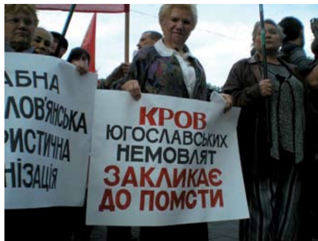
Пикет против НАТО во Львове

Отметим также, что в Харькове натовцы не ограничились экспертными посиделками, а отправились еще «в народ», выбрав для этого Институт монокристаллов НАН Украины. Видимо, для того, чтобы «развенчать миф» о том, что интеграция в Альянс повредит научному и военно-промышленному комплексу Украины. Как выяснилось, при участии НАТО в этом институте финансируется проект по производству легкой прозрачной брони. И это, мол, должно свидетельствовать о том, что после интеграции Украины в Альянс деятельность наших ученых останется востребованной. Интересно, что на сайте этого Института среди его научно-технических программ значится лишь одна – украинско-российская программа «Нанозифика и наноэлектроника», в рамках которой разрабатывается более 100 научно-исследовательских проектов. И все, больше там никакие программы не отмечены. Вот и считайте, насколько для Украины важнее заниматься проблемами будущих нанотехнологий или создавать для НАТО прозрачную броню (в самом деле, «Беркут» в прозрачных бронешилетах смотреться будет гораздо элегантнее при разгоне антинатовских демонстраций).