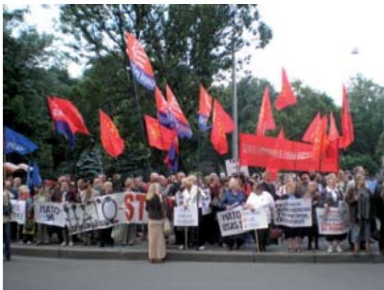
Львовский пикет против НАТО

С 16 по 17 мая Украину с двухдневным визитом посетил Генеральный секретарь НАТО Яап де Хооп Схеффер. Во время его пребывания на территории Украины были отмечены массовые акции протеста населения страны против вступления Украины в НАТО.