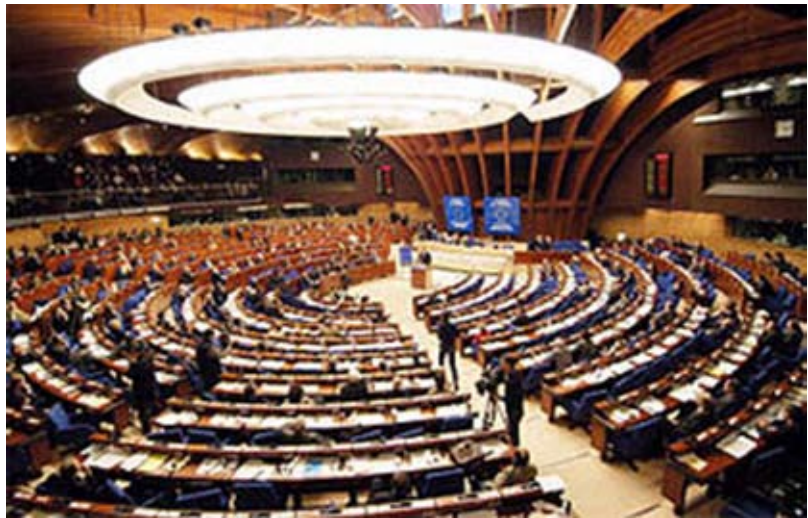
На заседании Парламентской ассамблеи Совета Европы (ПАСЕ)

Следует так же отметить, что на заседании ПАСЕ в Стокгольме позицию Украины пред-