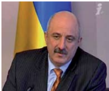
ПЛАЧКОВ Иван Васильевич

Указом Президента Украины № 720/2008 от 19.08.2008 И. В. Плячков был освобожден от должности Советника Президента Украины. В тот же день, указом Президента Украины № 721/2008 от 19.08.2008 И. Плячков был назначен заместителем Руководителя Государственного управления делами.