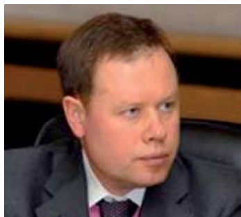
МАРМАЗОВ Василий Евгеньевич

Распоряжением Кабинета Министров Украины № 977-р от 23.07.2008 заместителем министра внутренних дел назначен В. Мармазов.