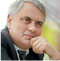
ПИТЦЫК Мирослав Васильевич

Указом Президента Украины № 781/2008 от 1 сентября 2008 года Советником Президента Украины назначен ПИТЦЫК Мирослав Васильевич.