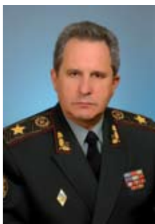
КИРИЧЕНКО Сергей Александрович

Указом Президента Украины № 810/2008 от 4 сентября 2008 года В. Ющенко ввел в состав Совета национальной безопасности и обороны Украины КИРИЧЕНКО Сергея Александровича – начальника Генерального штаба – Главнокомандующего Вооруженными Силами Украины, генерала армии Украины.