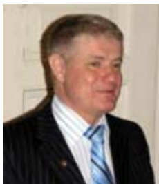
СЕНДАК Михаил Дмитриевич

Указом Президента Украины № 867/2008 от 26 сентября 2008 года Советником Президента Украины назначен СЕНДАК Михаил Дмитриевич.