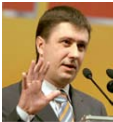
КИРИЛЕНКО Вячеслав Анатольевич

После того как, большинство членов фракции НУНС решили поддержать коалиционное соглашение с БЮТ и Блоком Литвина, глава фракции НУНС в Верховной Раде Украины В. Кириленко подал в отставку со своей должности.