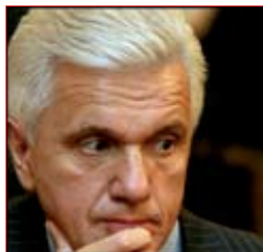
ЛИТВИН Владимир Михайлович

9 декабря 2008 года Владимир ЛИТВИН был избран Председателем Верховной Рады Украины. За кандидатуру В.Литвина проголосовали: Партия регионов – 3, 154 – от БЮТ, 40 депутатов от НУНС, 27 – коммунистов и 20 депутатов от Блока Литвина. Всего 244 народных депутатов Украины.