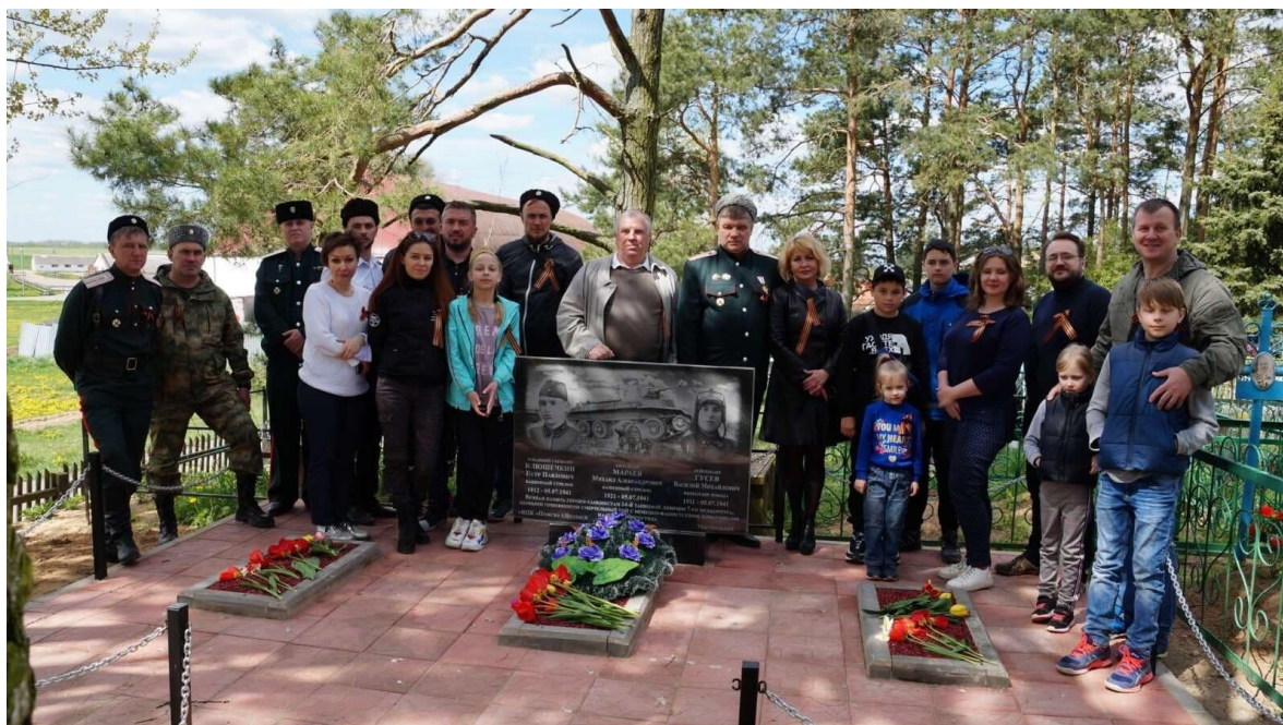
Обзор публикаций от 01.06.2020г.